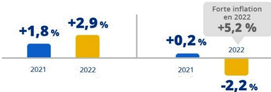
Évolution en 2021 et 2022 du salaire net mensuel moyen en équivalent temps plein des agents de la fonction publique de l'État